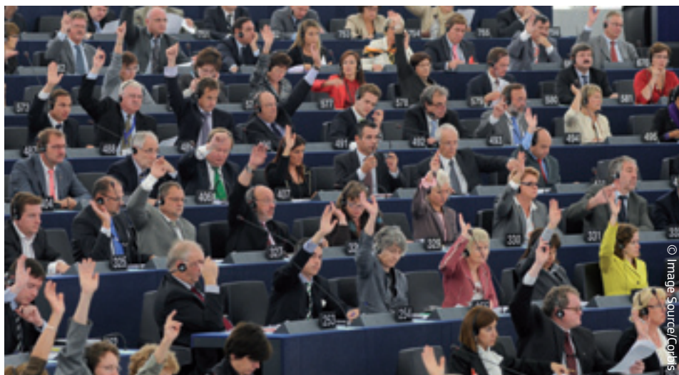
Il Parlamento europeo: il luogo dove è possibile far sentire la propria voce.

Nel 2011 un tedesco, Martin Schultz (Alleanza progressista di socialisti e democratici), è stato eletto presidente del Parlamento europeo.