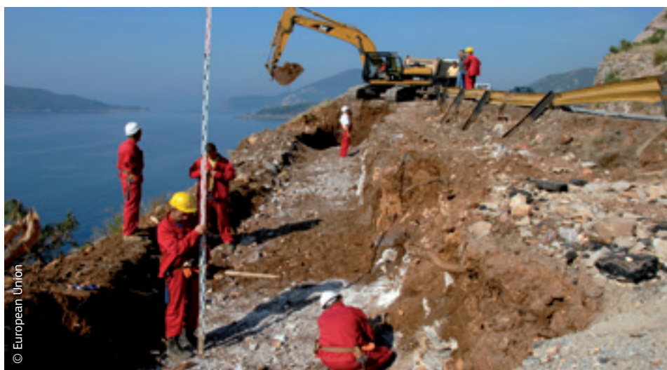
L'UE fornisce un sostegno finanziario per aiutare i paesi vicini a costruire la loro economia.

L'assistenza finanziaria fornita dall'Unione europea a entrambi i gruppi di paesi è gestita dallo strumento europeo di vicinato e partenariato (ENPI).